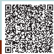
Zimmer-Buchung Thessoni classic

Es kombiniert die Vorzüge des Stadthotels mit der Ruhe und den Annehmlichkeiten eines Boutique Hotels auf dem Land. Das Naturschutzgebiet Katzenssee liegt direkt vor der Tür, und nur ein Katzensprung ist es bis Zürich City.