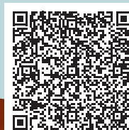
Zimmer-Buchung Thessoni classic

Es kombiniert die Vorzüge des Stadthotels mit der Ruhe und den Annehmlichkeiten eines Boutique Hotels auf dem Land. Das Naturschutzgebiet Katzenssee liegt direkt vor der Tür, und nur ein Katzensprung ist es bis Zürich City.